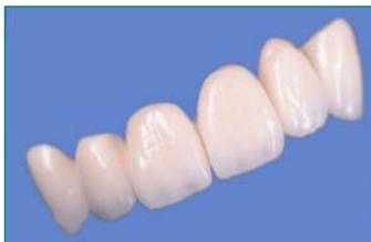
Frontzahnbrücke mit zahnfarbener Keramik verblendet

Eine Zahnlücke kann mit einer festsitzenden Brücke geschlossen werden. Die Brückenglieder ersetzen den fehlenden Zahn. Die Nachbarzähne dienen als tragende Pfeiler. Sie werden beschliffen und überkront, damit der Zahnersatz verankert werden kann.