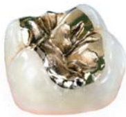
Präzises Gold-Inlay im zahntechnischen Labor hergestellt.

unbeschwert kauen können. Dies geschieht entweder durch plastische, weiche Füllungen, die vom Zahnarzt direkt in den Zahn eingebracht werden oder durch Inlays. Inlays sind Einlagefüllungen, die außerhalb des Mundes im zahntechnischen Labor hergestellt werden.