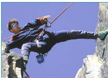
Zahn-Implantate bieten Sicherheit, festen Halt, Ästhetik und hohen

Implantate bieten weitere Vorteile gegenüber herkömmlichen Brücken oder Prothesen: der Kieferknochen bildet sich nicht zurück, sondern bleibt stabil. Nachbarzähne müssen nicht, wie bei Brücken, beschliffen werden. Keine Entzündungen durch Druckstellen und auch keine Beschädigung gesunder Zähne durch Klammern, wie dies bei Prothesen teils der Fall ist.